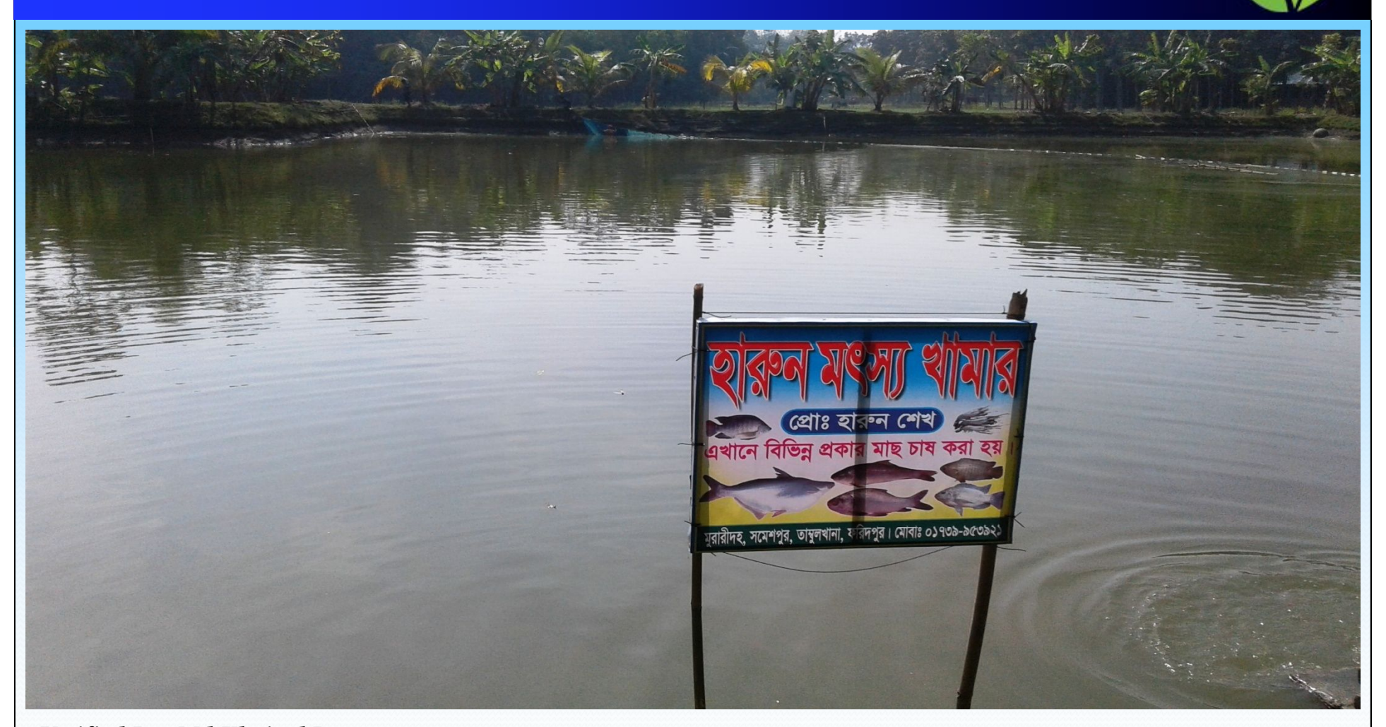
Verified By: Md.Khairul Basar NU Identified and PP Prepared by : Md. Shahabuddin Islam