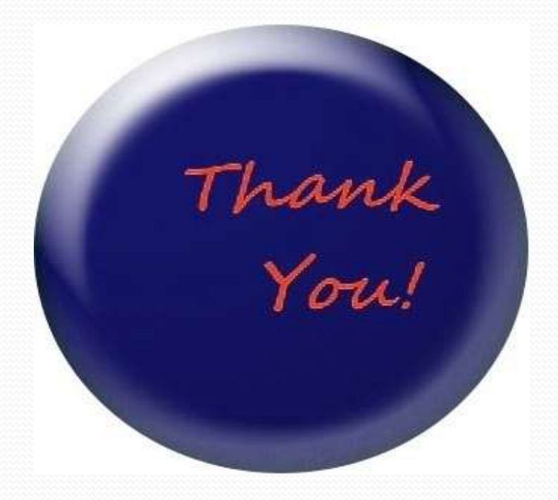
Presented at ...... Open Design Lab On 17, May 2017 Grameen Bank Auditoriam