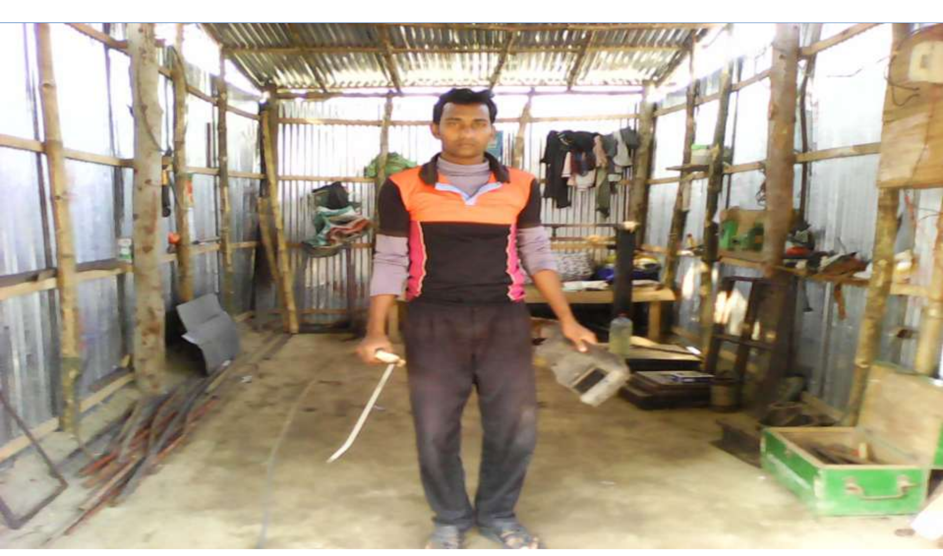
Business Proposal Prepared & Verified by: Shah Alam.