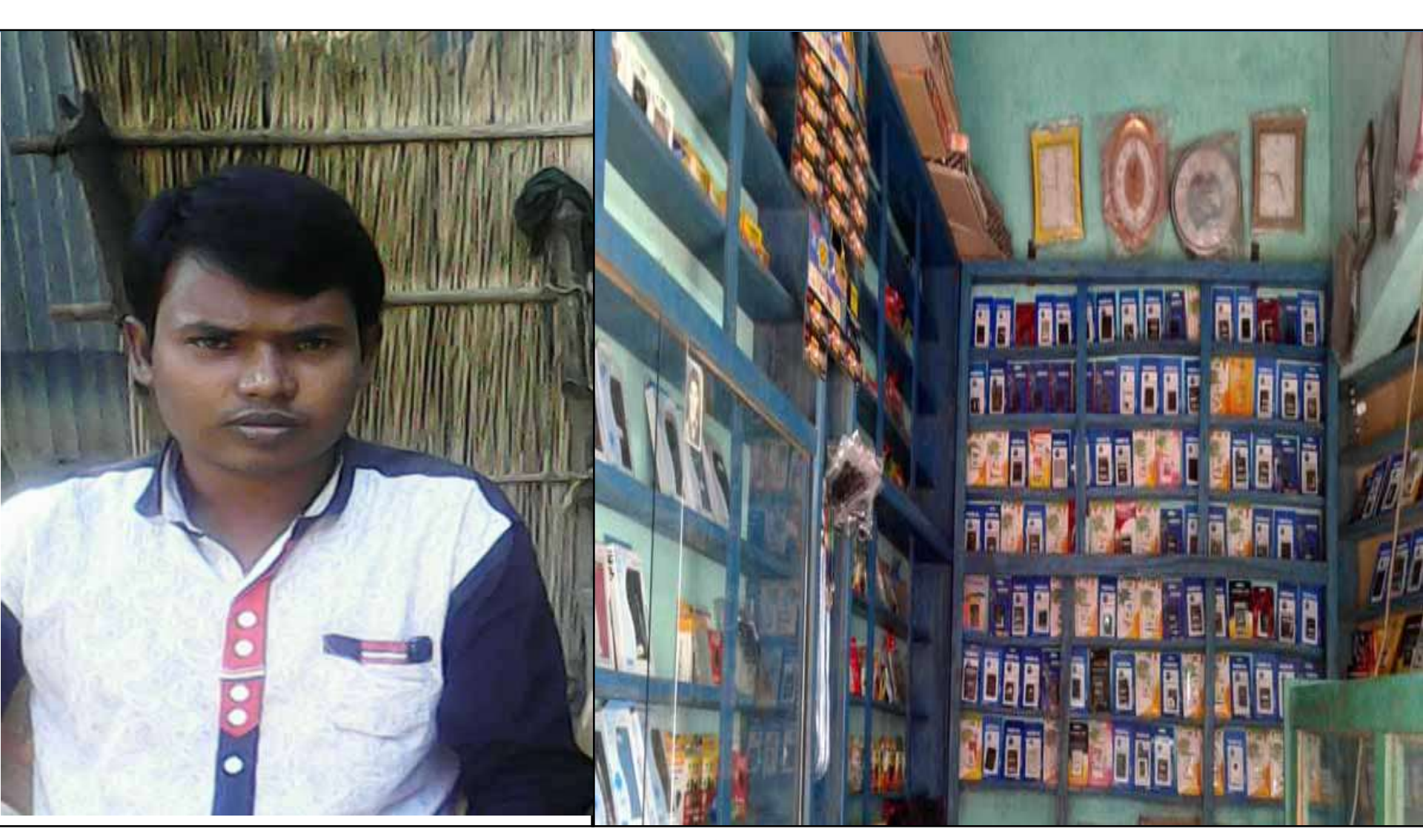
Business Proposal Prepared & Verified by: Fahina Yesmin Happy