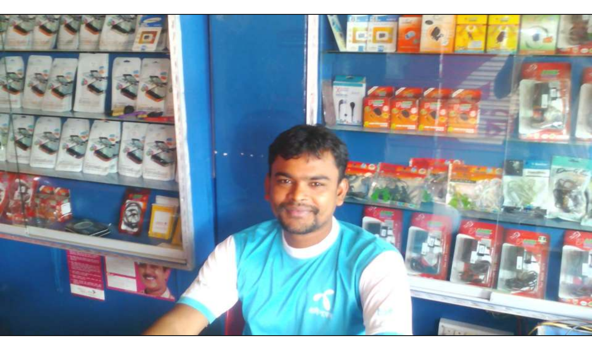
Business Proposal Prepared & Verified by: Fahina Yesmin Happy

Business Category: Telecom and IT Support