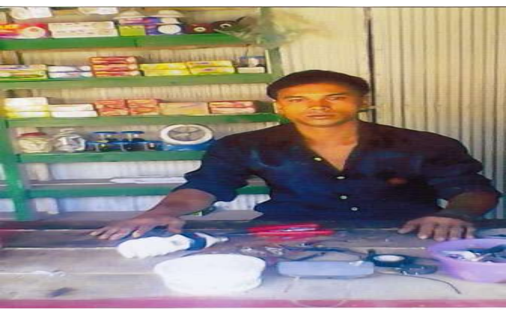
Business Proposal Prepared & Verified by: Naznin Akther

Proposed NU Business Name: M/S Sabuz Electric Dukan Business Category: General Retail & Wholesale