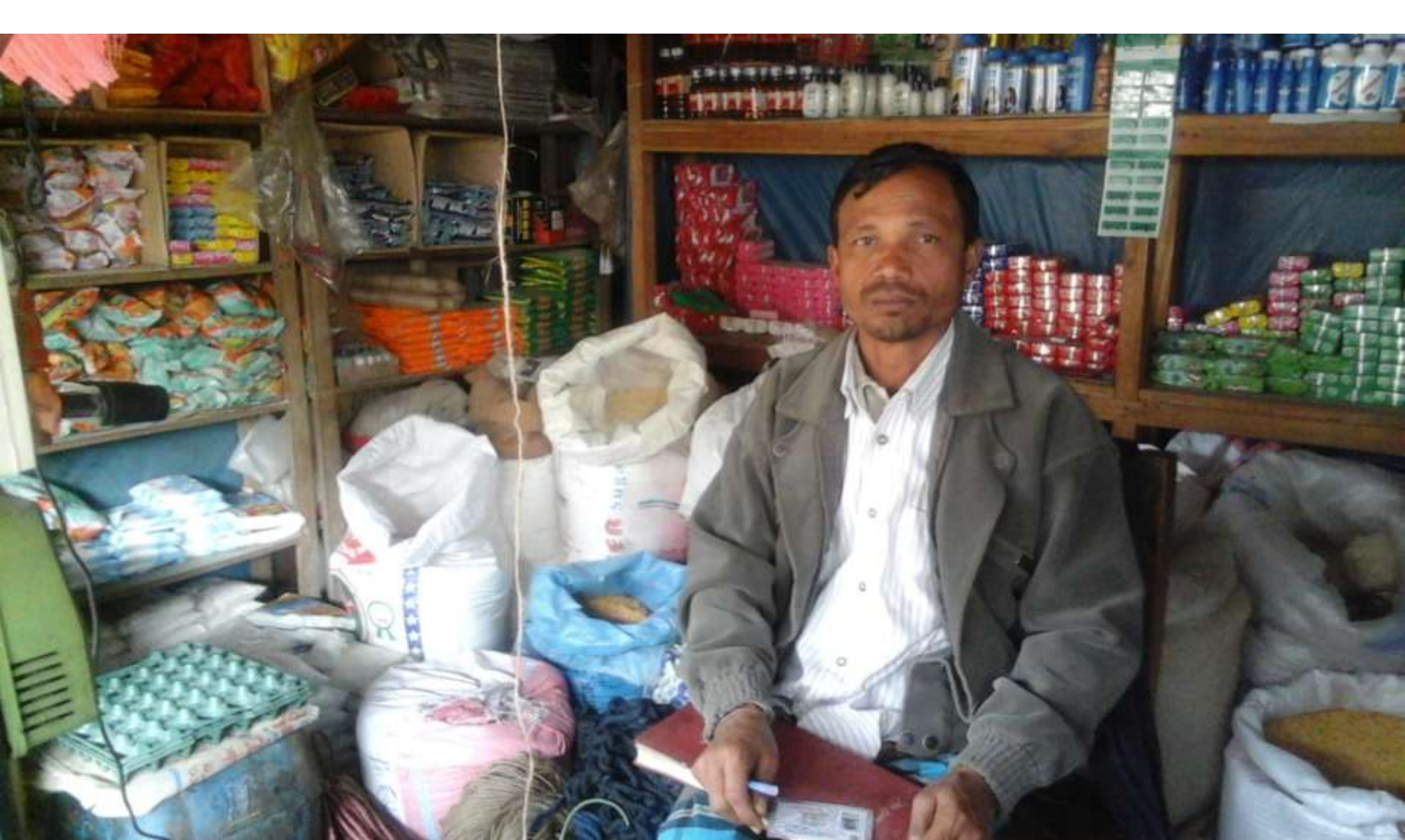
Project identified & Prepared by: A.M Saifur Rahman, Officer, Rangpur Sadar Unit