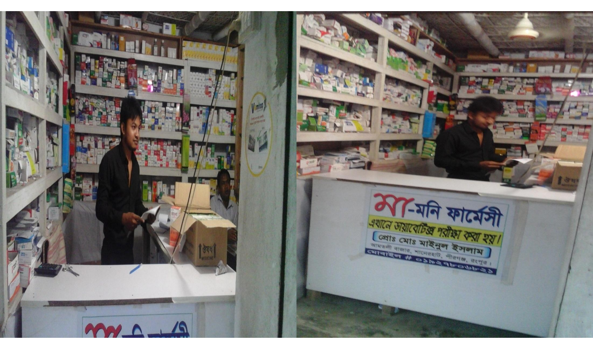
Business Proposal Identified & Prepared by: Md. Shahinur Islam,