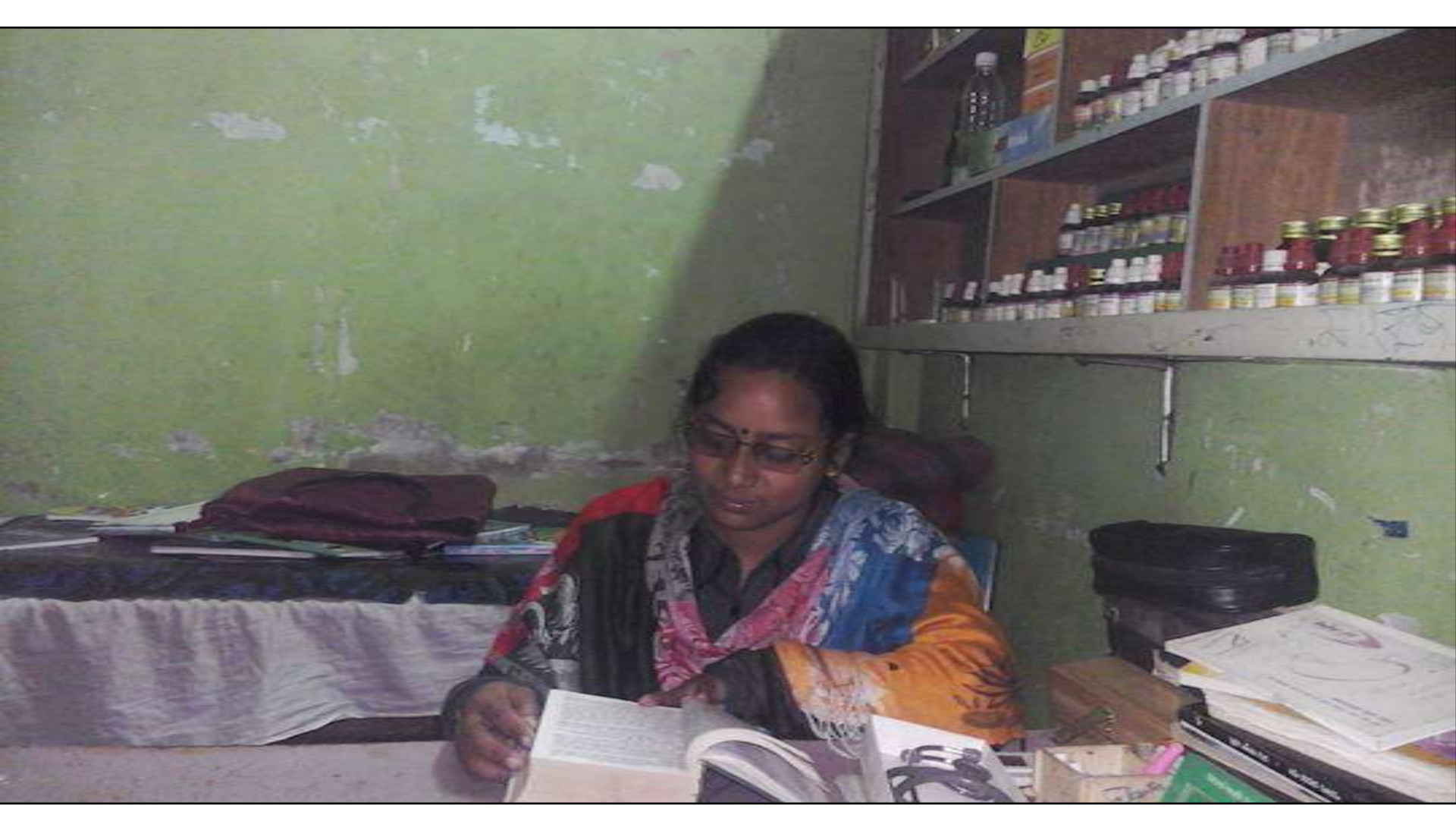
Business Proposal Identified & Prepared by